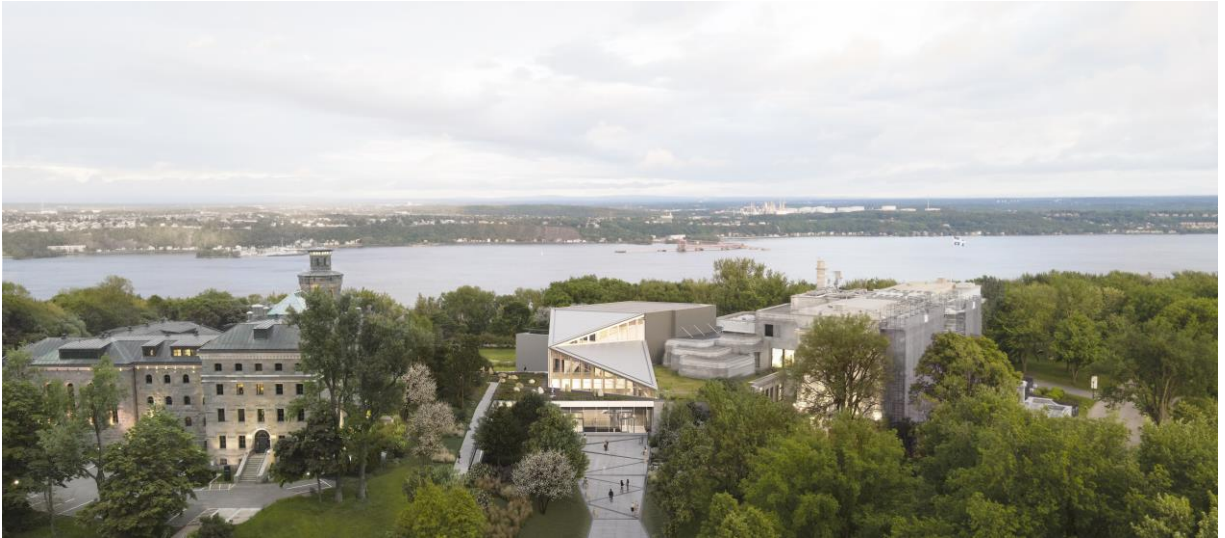
Figure 1 – © Les architectes fabg 2023