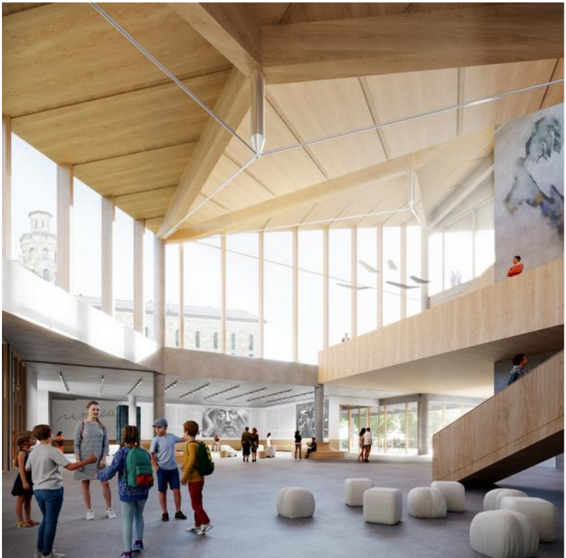
Figure 4 – À titre indicatif, aperçu du concept architectural de l'Espace Riopelle et de l'aménagement du hall en guise d'espace d'accueil. © Les architectes fabg 2023

« Notre objectif premier était d'entrer vraiment en résonance avec Riopelle. Inspirés par une expression de l'artiste, qui se disait « toujours en fuite », nous avons voulu créer un bâtiment à l'image de son œuvre en mouvement perpétuel. » – Éric Gauthier, architecte associé chez fabg