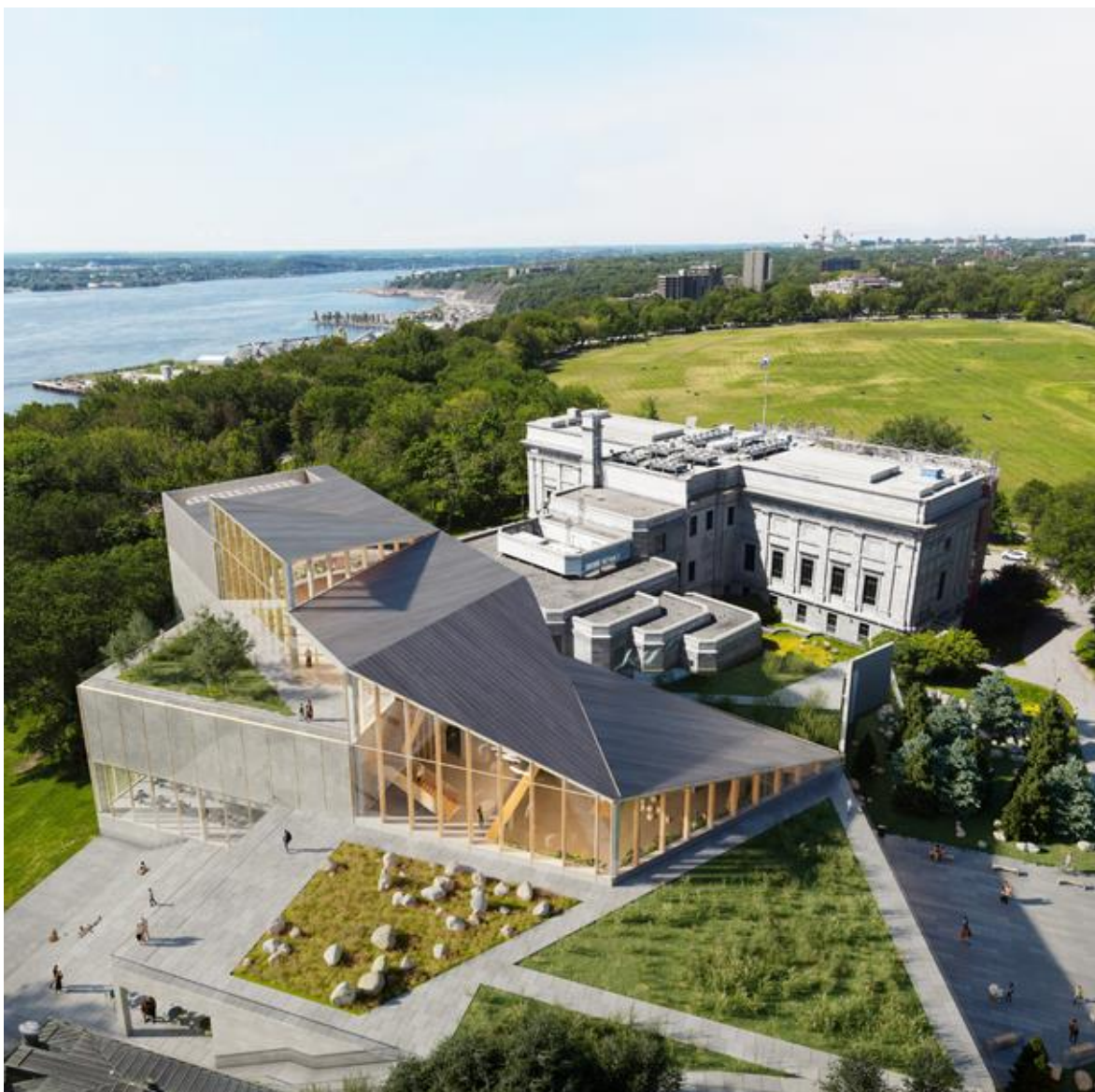
Figure 3 – Aperçu du concept architectural de l'Espace Riopelle. © Les architectes fabg 2023