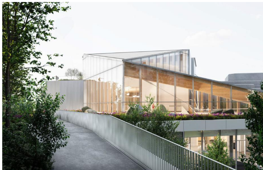
Figure 5 – À titre indicatif, un aperçu du sentier piéton (vue partielle). Se référer aux plans joints pour de plus amples détails. © Les architectes fabg 2023

À ce titre, en lien avec la vocation des lieux, les mots clés proposés pouvant servir de pistes de réflexion à la réalisation de l'œuvre sont les suivants : accueil, prestige, expérience émotive, sensorielle et immersive, parcours, découverte, trait d'union (entre deux bâtiments, passé/avenir, urbanité/fleuve, etc.), innovation, dialogue avec la nature/culture, diversité, inclusion, fierté panrégionale et vitrine internationale.