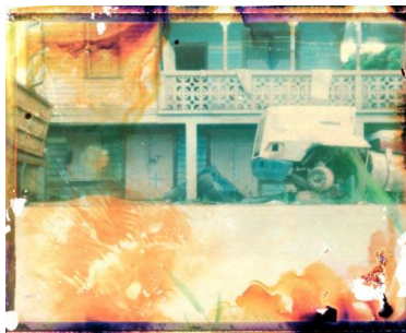
Révélations anticipées (détail), 2010-2014, impression à jet d'encre réalisée au sténopé

La captation numérique d'une image a engendré une perte de matérialité dans le procédé photographique. En effet, le traitement de laboratoire dont la moindre variation des éléments thermiques ou chimiques altérant la restitution de l'image semble être en désuétude depuis l'utilisation de l'image pixellisée.