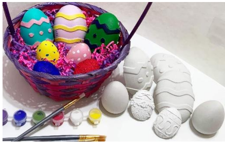
Création Jessyka Tremblay 2021 ©TiBas